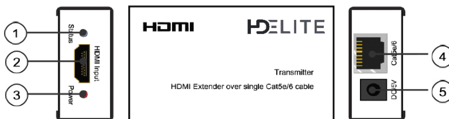
Schéma Emeteur (conversion HDMI vers Ethernet)