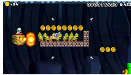
... Ou pulvérisez des ennemis avec un vaisseau cracheur de feu...