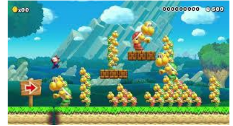
... Ou évitez des piles d'ennemis géants !