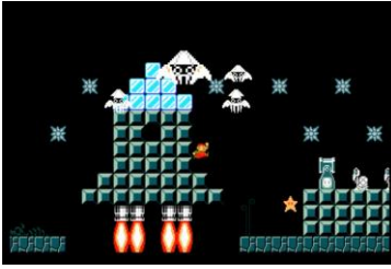
Affrontez dans l'espace des pieuvres avec des ailes...

canons pouvant tirer des plantes carnivores, cachez des ennemis dans les blocs mystères, ou faites apparaître des Koopas pouvant chevaucher un Bowser ailé, le tout sur des trampolines !