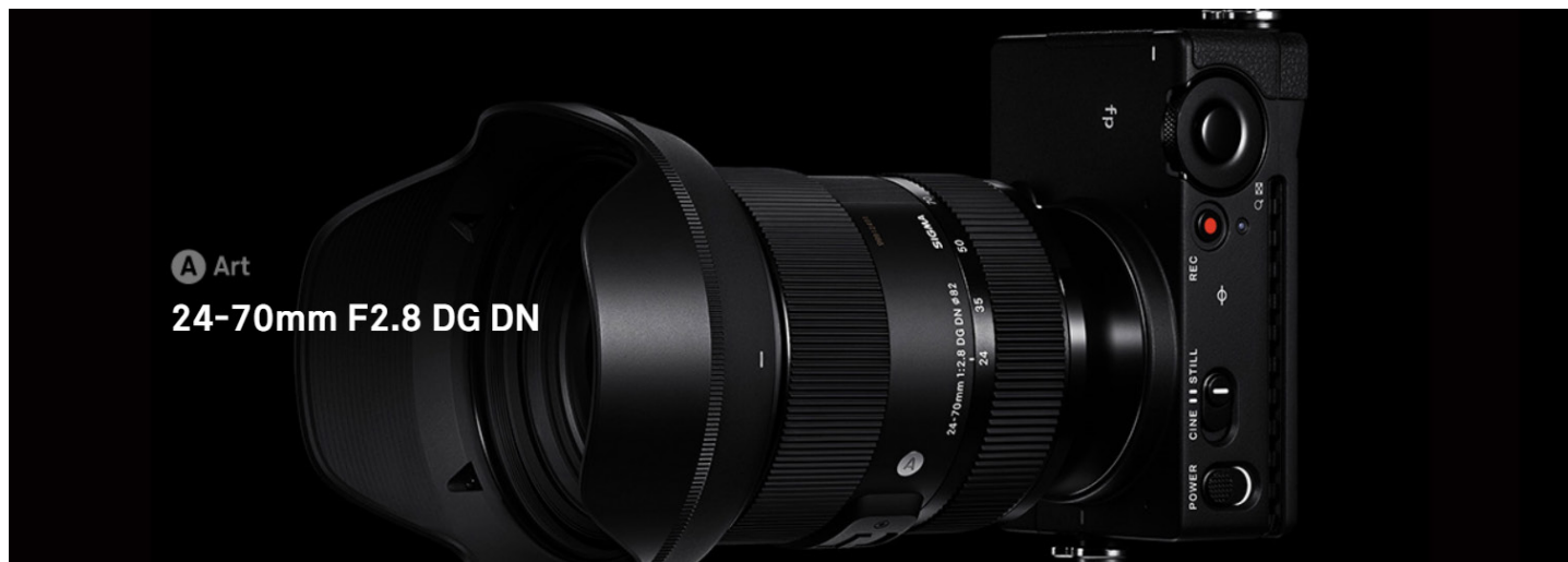
A Art 24-70mm F2.8 DG DN