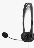
Casque stéréo HP 3,5mm G2 428H6AA