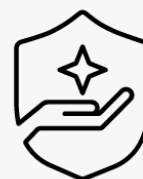
3 ans, enlèvement et retour U4812E