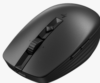
Souris silencieuse rechargeable HP 710 6E6F2AA