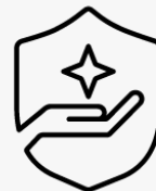
3 ans, enlèvement et retour U1P3SE