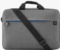
Sacoche pour ordinateur portable HP Prelude 15,6 pouces 2Z8P4AA