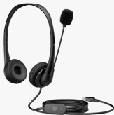
Casque stéréo USB HP G2 428H5AA