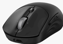
Souris sans fil rechargeable HP 700 AZ7B0AA