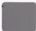
Tapis de souris désinfectable HP 100 8X594AA