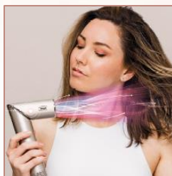
Utilisation sans dommage thermique