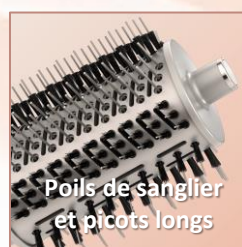
Démêle, lisse, adoucit et fait briller