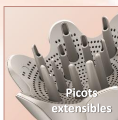
Séchage homogène des racines aux pointes pour une meilleure définition des boucles.