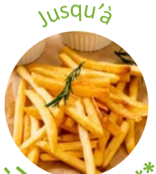
Jusqu'à -75% d'huile**