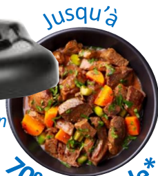
Jusqu'à 70% + rapide*