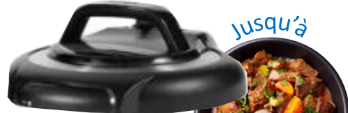
Couvercle de cuisson sous-pression inclus