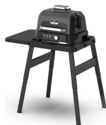
Table avec hauteur ajustable