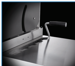
Bac pour charbon de bois réglable en hauteur en 6 niveaux