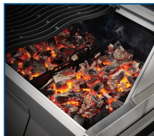
Lit de charbon de bois en trois parties