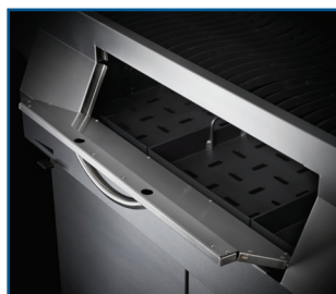
Porte de chargement pour charbon de bois