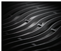
Grilles WAVE™ en fonte émaillée