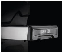
Une tablette rabattable