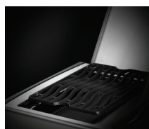
Grand brûleur latéral infrarouge SIZZLE ZONE™