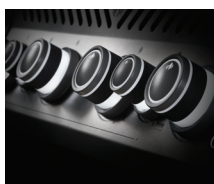
Boutons de commande éclairés