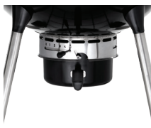
Precision control air inlet system