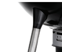
Joints pieds en fonte aluminium pour une hauteur de cuisson optimale