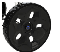
Large roues Ø 20 cm avec nouveaux enjoliveurs