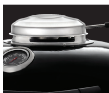
Cheminée PRO acier inoxydable