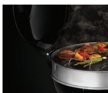
Charnière PRO améliorée