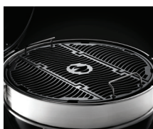
Grille en fonte émaillée revêtement porcelaine WAVE™