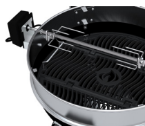
Ceinture inox pour support rôtissoire