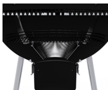
Système ventilation chaleur / vortex