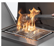
brûleur latéral infrarouge SIZZLE ZONE™