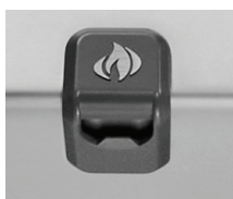
Décapsuleur sur la tablette latérale