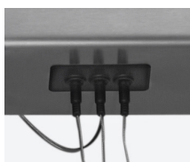
inclus 3 sondes de température