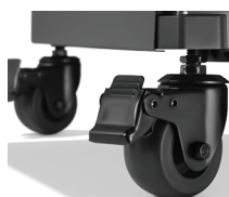
De nouvelles roues solides, réglables en hauteur