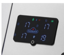
Ecran LCD 5"