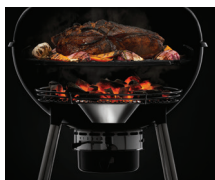
Système ventilation chaleur / vortex