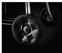
Large roues Ø 20 cm avec nouveaux enjoleurs