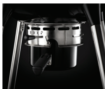
Precision control air inlet system