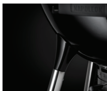
Jointes pieds en fonte aluminium pour une hauteur de cuisson optimale