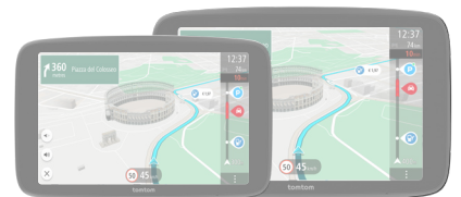
TomTom GO Superior