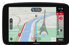
TomTom GO Navigator