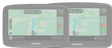
TomTom GO Classic

TomTom est reconnu pour sa convivialité et ses nombreuses fonctionnalités spécialement conçues pour vous assurer un voyage agréable et intuitif. Avec sa fonction RouteBar unique, ses mises à jour des cartes du monde, TomTom Traffic et 12 mois d'alertes des zones de danger inclus, le GO Navigator est un GPS complet, idéal pour tous les conducteurs