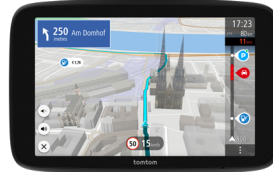
TomTom GO Navigator