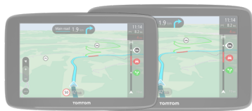
TomTom GO Classic

TomTom GO Navigator vous y conduit en toute sérénité. TomTom est reconnu pour sa convivialité et ses nombreuses fonctionnalités spécialement conçues pour vous assurer un voyage agréable et intuitif. Avec sa fonction RouteBar unique, ses mises à jour de cartes Europe, TomTom Traffic et 12 mois de services Premium et d'alertes des zones de danger inclus font du GO Navigator 7 un GPS complet. Le grand écran 7" assure confort et lisibilité, idéal pour tous les conducteurs.