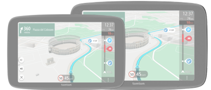
TomTom GO Superior