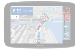
GO Expert Plus PP