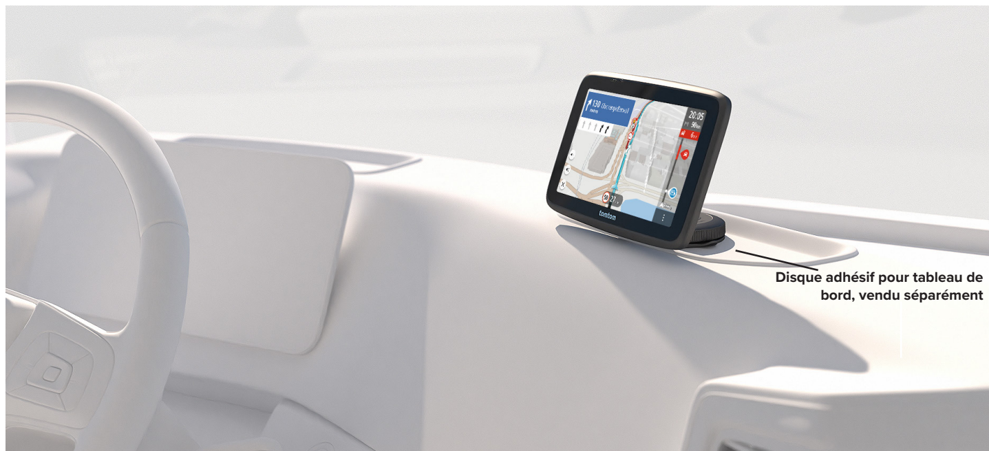
Disque adhésif pour tableau de bord, vendu séparément

Conçu pour les conducteurs de grands véhicules qui exigent une expérience de navigation professionnelle. Le TomTom GO Professional 2ème génération optimise les itinéraires pour une conduite efficace et informée. Ajoutez les dimensions, le poids, la vitesse maximale et le type de chargement de votre véhicule pour obtenir des parcours personnalisés (hauteur des ponts, tunnels ADR, restrictions des marchandises dangereuses, ect...). Soyez à l'heure avec TomTom Traffic, le service Info-traffic en temps réel de TomTom. Profitez des points d'intérêt spécifiques aux camions, des mises à jour mensuelles de la carte et des fonctions exclusives de TomTom. Ne laissez plus de place à l'incertitude, optez pour le GO Professional.