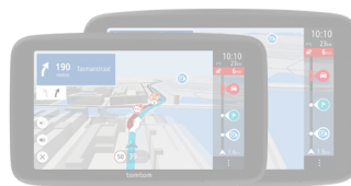
GO Expert Plus 6"/7"