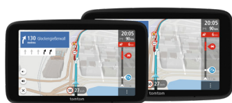
GO Professional 5"/6"

Conçu pour les conducteurs de grands véhicules qui exigent une expérience de navigation professionnelle. Le TomTom GO Professional 2ème génération optimise les itinéraires pour une conduite efficace et informée. Ajoutez les dimensions, le poids, la vitesse maximale et le type de chargement de votre véhicule pour obtenir des parcours personnalisés (hauteur des ponts, tunnels ADR, restrictions des marchandises dangereuses, ect...). Soyez à l'heure avec TomTom Traffic, le service Info-traffic en temps réel de TomTom. Profitez des points d'intérêt spécifiques aux camions, des mises à jour mensuelles de la carte et des fonctions exclusives de TomTom. Ne laissez plus de place à l'incertitude, optez pour le GO Professional.