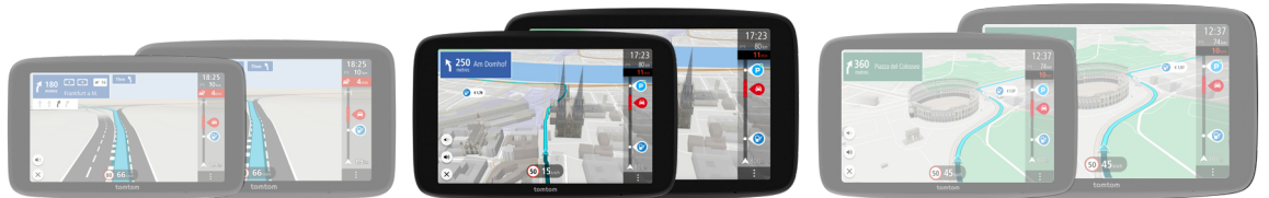
TomTom GO Classic 2ème génération

Il inclut de nombreuses fonctionnalités conçues pour rendre votre trajet plus agréable. Sa fonction RouteBar unique, ses cartes d'Europe (mises à jour incluses), ses alertes d'infos trafic en temps réel et les alertes de zones de danger sont autant d'éléments qui font du GO Navigator 2ème génération un GPS complet. De plus, le grand écran 6" ou 7" assure confort et lisibilité, faisant ainsi du GO Navigator le compagnon de voyage idéal de tous les conducteurs.