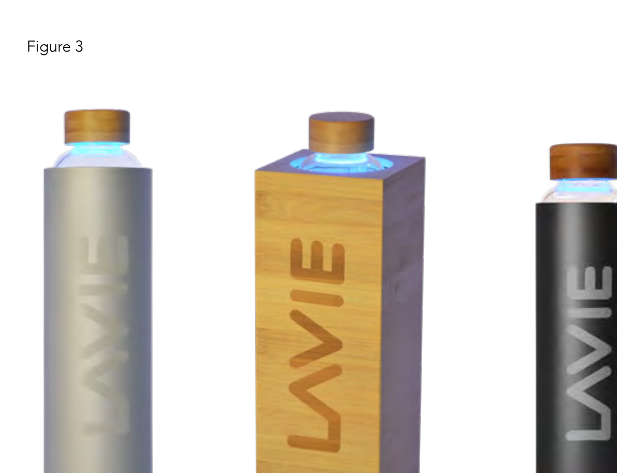
Appareil en cours de fonctionnement. La lumière bleue indique que les LEDs émettent un rayonnement UVA et ainsi traitent l'eau contenue dans la bouteille LaVie. A la base de l'étui, la couleur verte indique une durée de traitement de 15 minutes.

La durée du traitement est de 15 minutes par défaut, repérée par une couleur VERTE à la base de l'étui qui persiste tout au long du traitement (Figure 3). A la fin du traitement, les LEDs et la base de l'étui s'éteignent. La bouteille contenant de l'eau désormais purifiée peut-être retirée de l'étui pour une consommation immédiate ou être placée dans le réfrigérateur. Recommandation : une fois ouverte, l'eau contenue dans la bouteille doit être consommée dans les 48 heures.