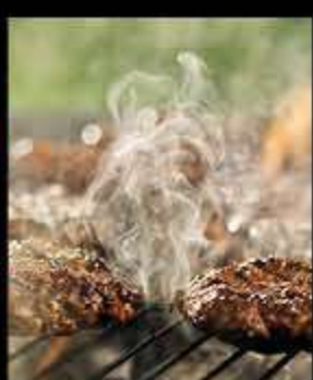
GRILLER AU CHARBON