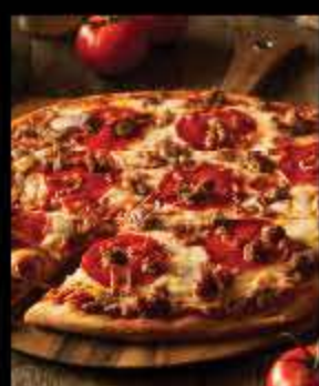
CUIRE AU FOUR