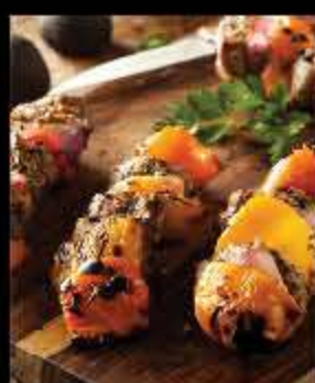
CUIRE AU BARBECUE