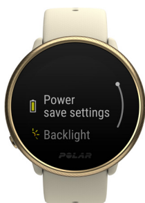
Options d'économie de batterie