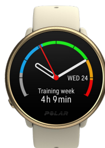
Résumé de la semaine