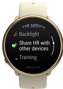
Mode de capteur de la fréquence cardiaque