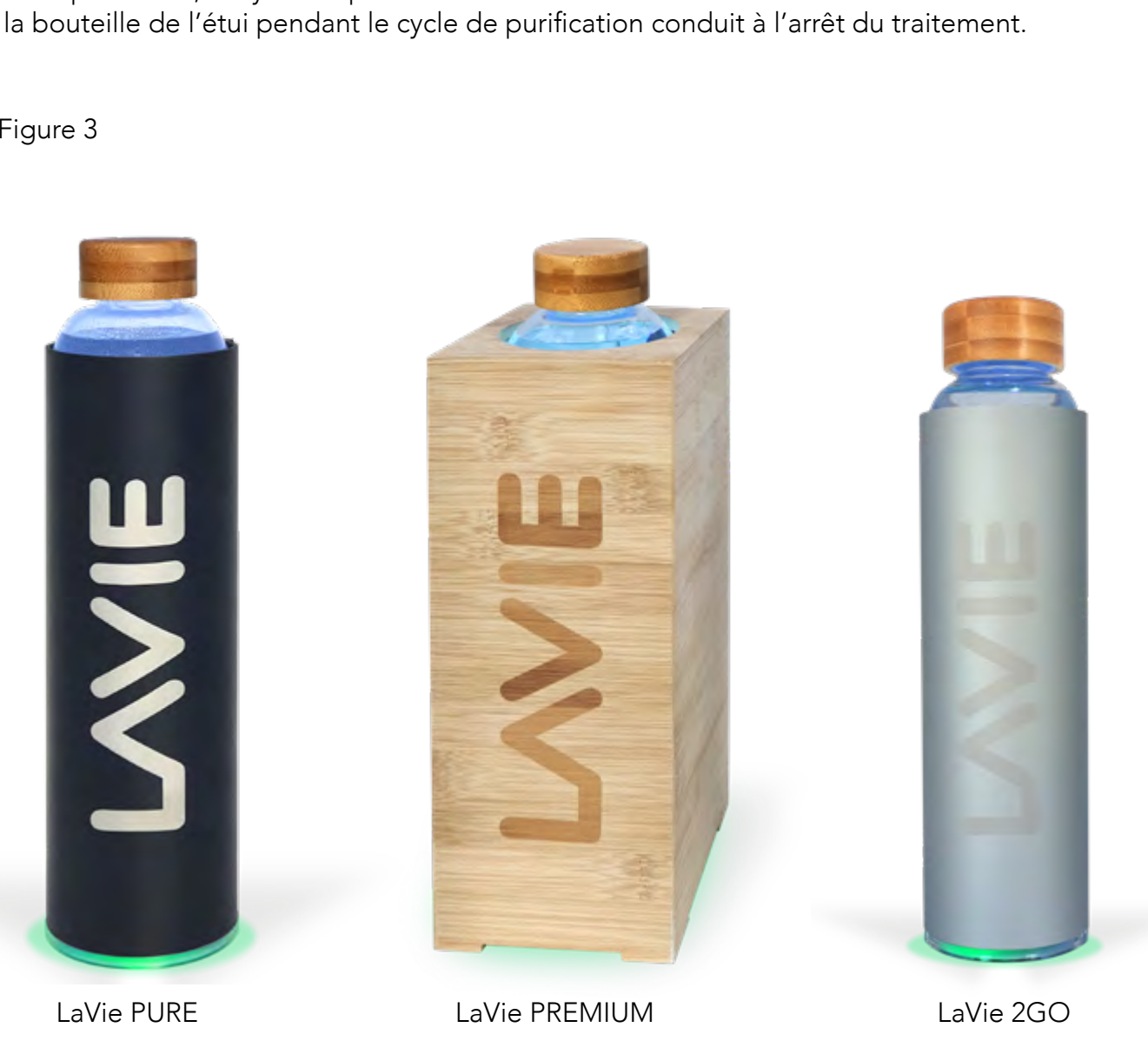
Appareil en cours de fonctionnement. La lumière bleue indique que les LEDs émettent un rayonnement UVA et ainsi traitent l'eau contenue dans la bouteille LaVie. A la base de l'étui, la couleur verte indique une durée de traitement de 15 minutes.

La durée du traitement est de 15 minutes par défaut, repérée par une couleur VERTE à la base de l'étui qui persiste tout au long du traitement (Figure 3). A la fin du traitement, les LEDs et la base de l'étui s'éteignent. La bouteille contenant de l'eau désormais purifiée peut être retirée de l'étui pour une consommation immédiate. Conserver la bouteille fermée à température ambiante ou au réfrigérateur. Recommandation : une fois ouverte, l'eau contenue dans la bouteille doit être consommée dans les 48 heures.