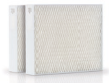
FILTRES DE DIFFUSION