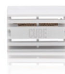
WATER CUBE ANTI-GERMES

Vous souhaitez humidifier l'air en consommant le moins d'énergie possible ? Alors optez pour OSKAR ! Avec son hygrostat, il permet d'humidifier l'air précisément, et donc de manière économique. Discret, il est parfait dans une chambre : vous pouvez aussi désactiver ses LED. Pour votre bien-être et votre santé, un indicateur vous indique quand changer les filtres. Ajoutez quelques gouttes d'huile essentielle pour assainir encore plus l'air que vous respirez !