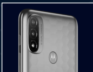
Double capteur photo