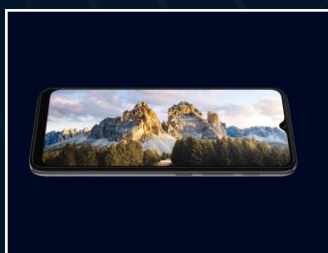
Ecran immersif 6,5" HD+