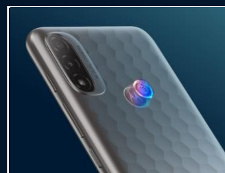
Lecteur d'empreinte dorsal