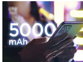
Batterie longue durée avec charge rapide 30W