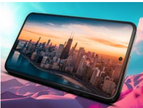
Ecran OLED 6,5" 120Hz