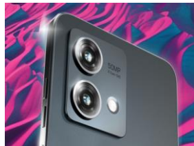
Double capteur 50MP avec stabilisation optique