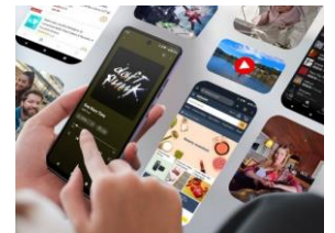
Stockage 512 Go RAM 12 Go