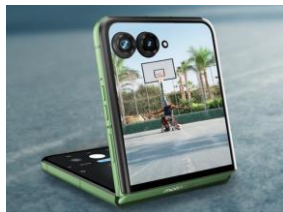
Double capteur 50MP boosté par IA avec zoom