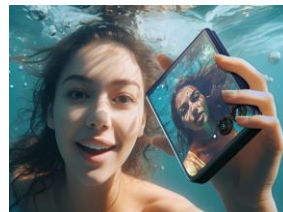
Résistant à l'eau IPX8