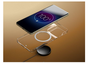
Batterie longue durée avec charge ultra rapide 90W