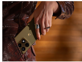
Quadruple capteur 50MP avec zoom boosté par l'IA