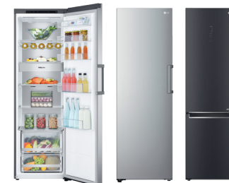
Réfrigérateurs une porte Congélateurs une porte Réfrigérateurs Combinés

La technologie Door Cooling + ™ permet un refroidissement rapide et homogène, idéal pour la conservation des aliments.