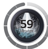
TurboWash™ Conventionnel LG 1 seul jet

Les laves-linges LG bénéficiant de la technologie TurboWash™ 360° (1) sont équipés de 4 jets permettant une aspersion de l'eau et de la lessive à 360° au sein du tambour. Cette technologie permet de réduire le temps de lavage à 39 minutes avec une meilleure efficacité énergétique tout en limitant l'usure prématurée des textiles en comparaison avec un lave-linge LG conventionnel avec TurboWash™. (2)