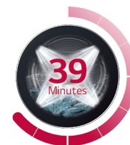
TurboWash™ 360° (1) 4 jets