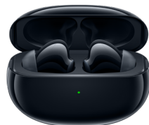
Écouteurs Bluetooth OPPO Enco X