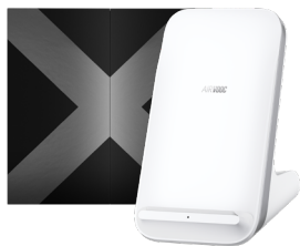
Chargeur à induction AirVOOC

Précommandez et recevez des accessoires OPPO en cadeau !