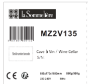
Exemple d'étiquette du carton