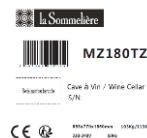
Exemple d'étiquette du carton

Vous recevrez au plus tard le 28/02/2022 et après réception de votre dossier conforme, votre remboursement. Pour toute question à propos de l'offre vous pouvez nous contacter à contact@lasommeliere.com