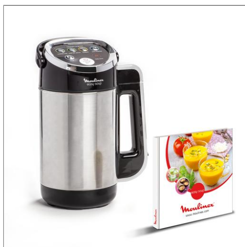
EASY SOUP BLENDER CHAUFFANT LM841810