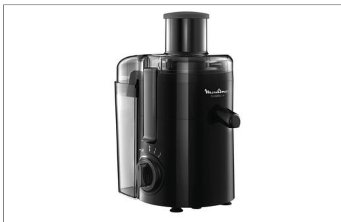
frutelia - centrifugal