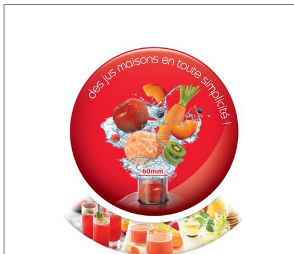
Frutelia plus, Centrifugeuse, 350 W, 2 vitesses + pulse, Noire Centrifugeuse JU370810