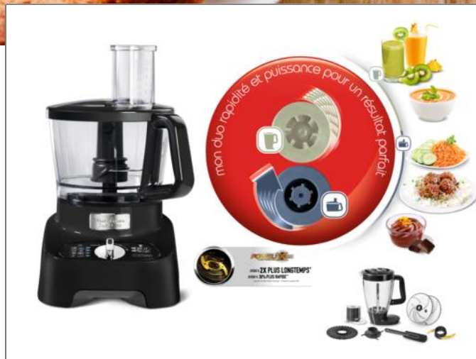
DOUBLE FORCE 1000 W NOIR + 8 ACCESSOIRES ROBOT MULTIFONCTION FP821811