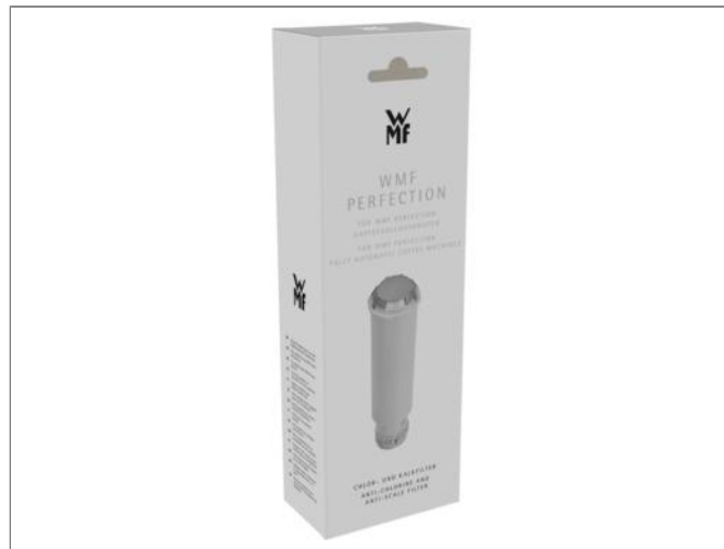
WMF Perfection Cartouche filtrante Cartouche filtrante XW133000