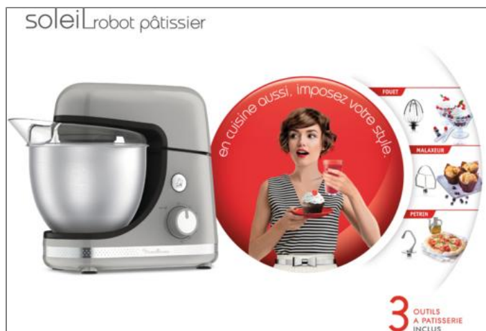
ROBOT PÂTISSIER SOLEIL PEPPER 900 W ROBOT PATISSIER QA250E10