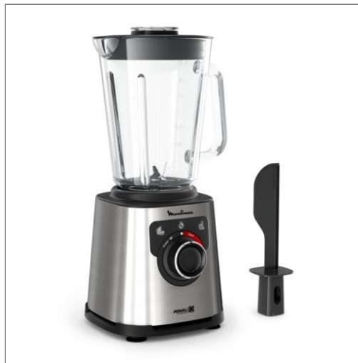
Blender PerfectMix+ 1200 W Noir et Métal BLENDER LM871D10