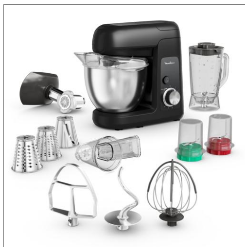
Bake Partner, Robot pâtissier puissant de 1 100 W ROBOT PÂTISSIER QA525810