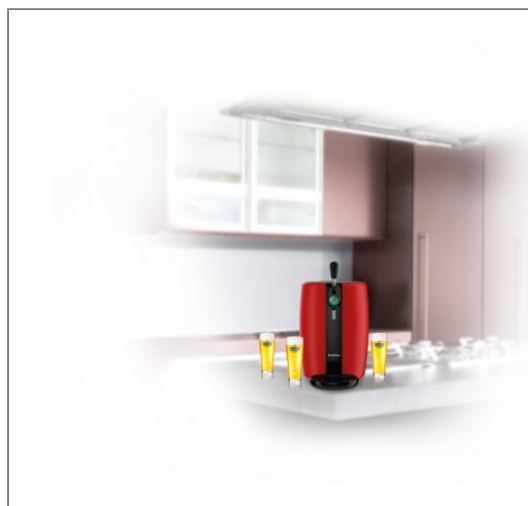
BEERTENDER ROUGE Machine à bière VB310510