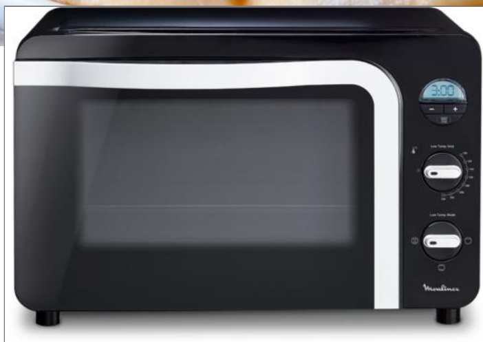
Four Moulinex delicio 39l FOUR NEW DELICE XL NOIR EU OX283810