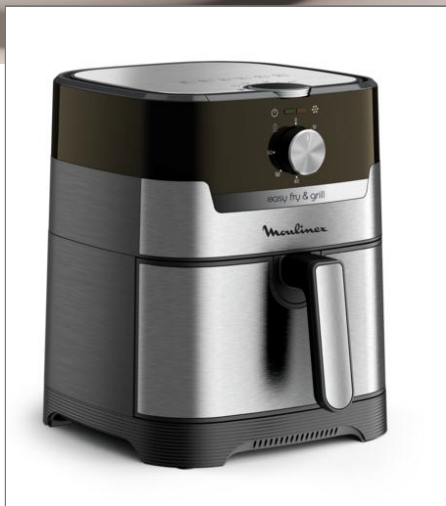
EASY FRY & GRILL MECANIQUE Friteuse sans huile 4,2 L EZ501D10