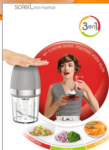
MINI HACHOIR SOLEIL PEPPER 350 W MINI HACHOIR DJ360E10