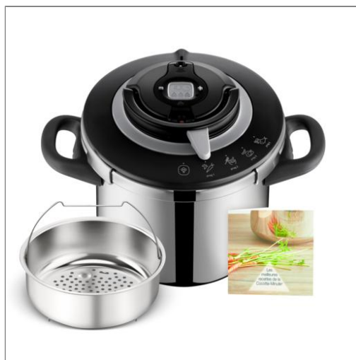
Cocotte-minute® Clipso+ CHEF 8 L P4551400