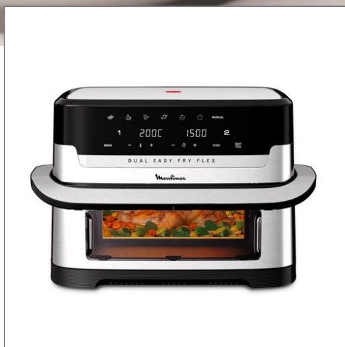
Easy Fry Dual Flex, air fryer, Grand tiroir 9 L, double zone, séparateur amovible DUAL FLEX 9L EZ922DF0