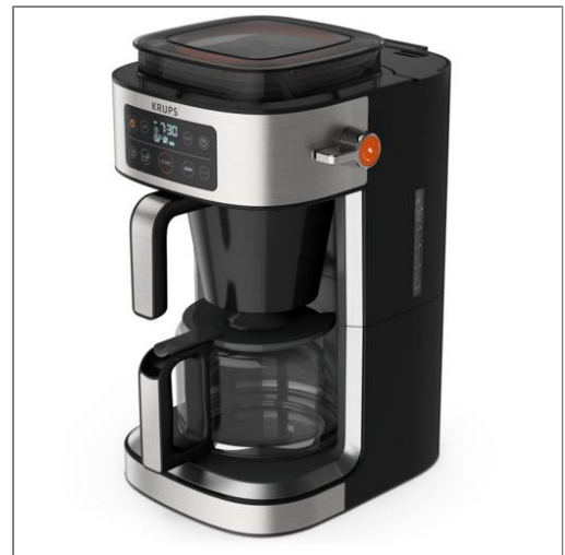
AROMA PARTNER Cafetière KM760D10