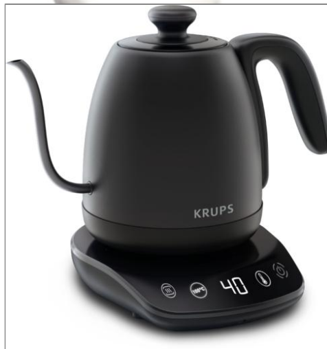
Bouilloire col de cygne Café Control 8 sélections de température Bouilloire BW923810