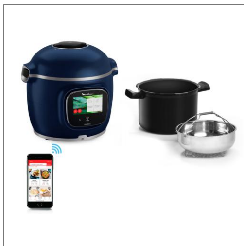
Cookeo Touch Pro avec balance intégrée Multicuisson intelligent haute pression avec balance intégrée CE943410