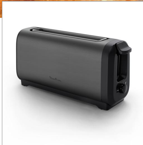
Grille-pain Subito Moulinex longue fente inox noir Grille-pain longue fente LS5S08E0